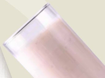
Strawberry Milk Shake