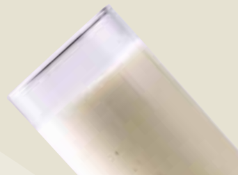
Banana Milk Shake