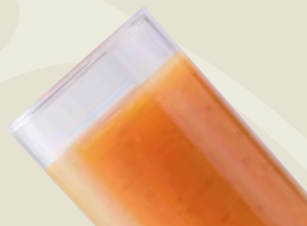
Mixed Fruits Juice