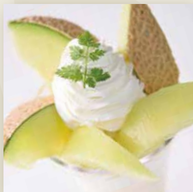
Musk Melon Parfait