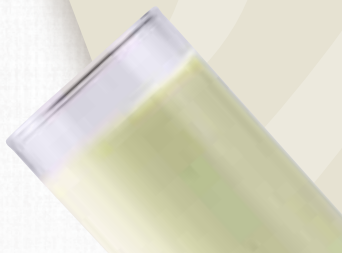
Avocado Milk Shake