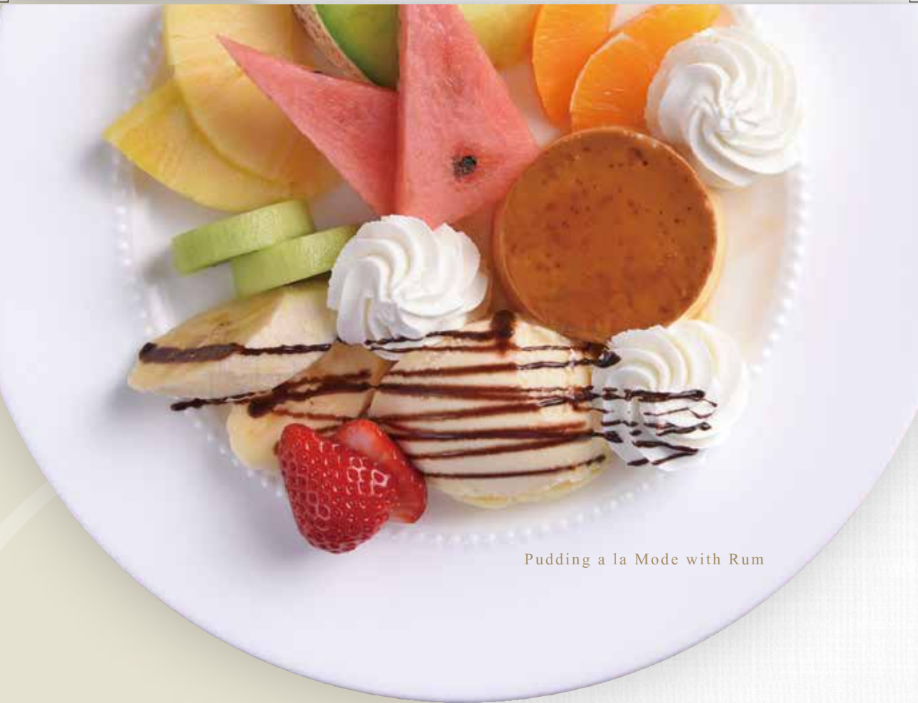
Pudding a la Mode with Rum