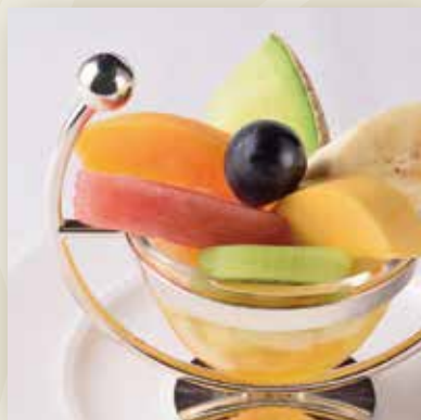
Fruits Punch / Plain Type