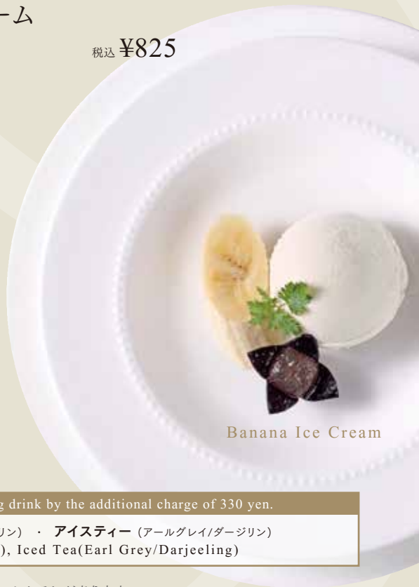
Banana Ice Cream

+税込330円で下記ドリンクをお付けいたします。following drink by the additional charge of 330 yen.