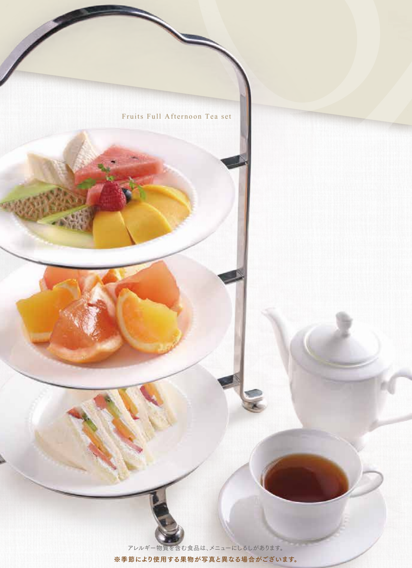
Fruits Full Afternoon Tea set

コーヒー (アイス/ホット) ・ ホットティー[ボット付] (アールグレイ/ダージリン) ・ アイ스티ー (アールグレイ/ダージリン) Coffee(ice/hot), Hot Tea pot(Earl Grey/Darjeeling), Iced Tea(Earl Grey/Darjeeling)