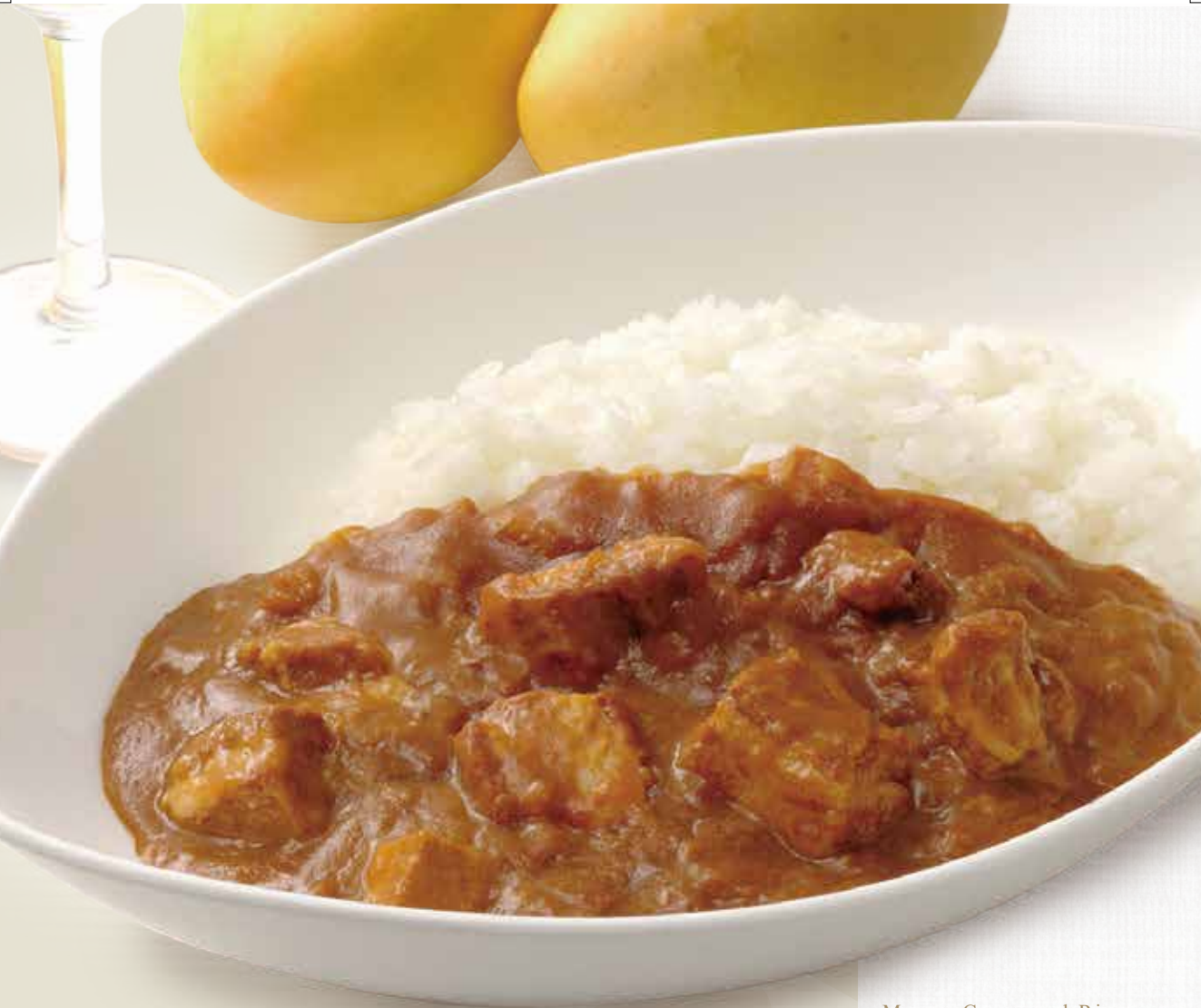
Mango Curry and Rice