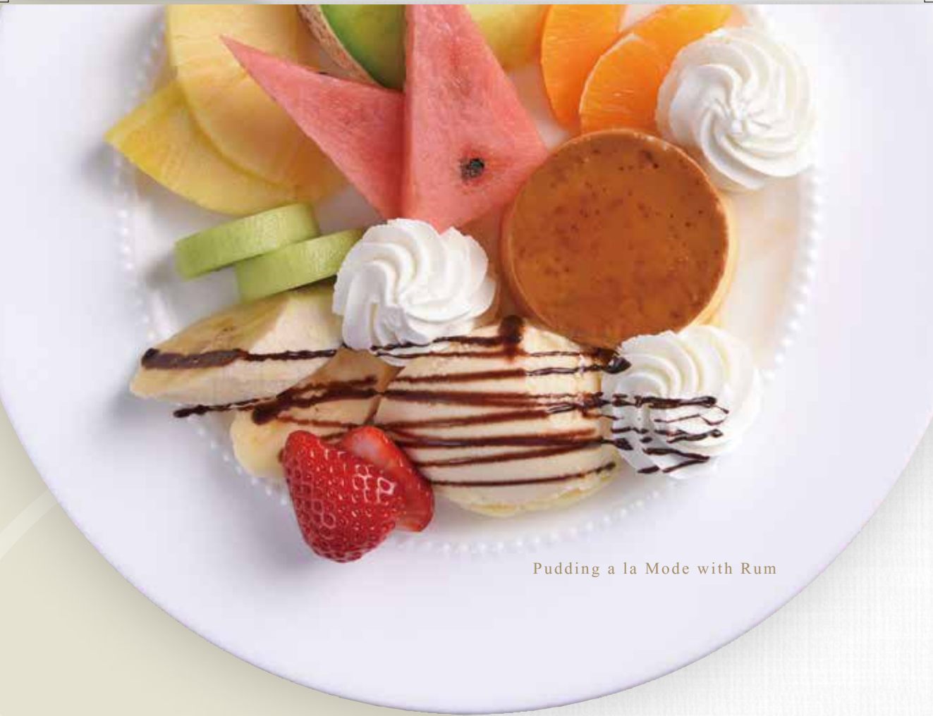
Pudding a la Mode with Rum