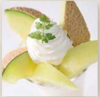
Musk Melon Parfait