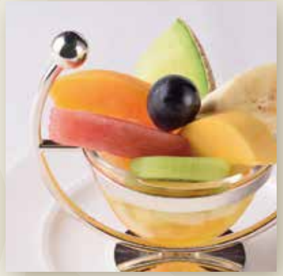
Fruits Punch / Plain Type