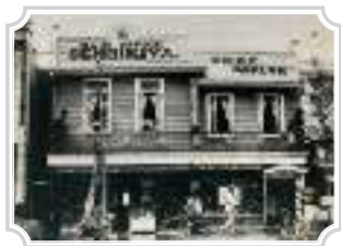
1923年(大正12年)頃 関東大震災後の室町本店

Around 1923: the flagship store in Nihombashi-Muromachi after the Great Kanto Earthquake