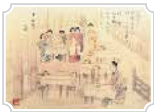
1916年(大正5年)頃 フルーツパラーの様子