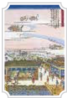
1834年(天保5年)頃 創業当時の様子