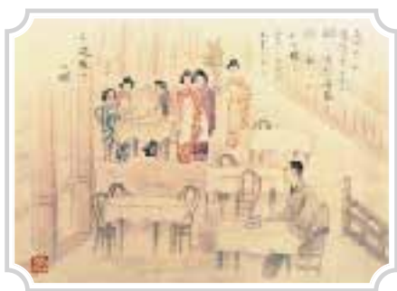
1916年(大正5年)頃 フルーツパラーの様子