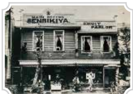
1923年(大正12年)頃 関東大震災後の室町本店

Around 1923: the flagship store in Nihombashi-Muromachi after the Great Kanto Earthquake