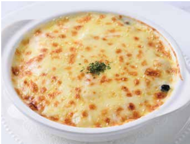
Creamed Seafood and Mushroom on Rice 海の幸とキノコのドリア(ミニデザート付き)

特定原材料等28品目: 小麦・乳・卵・大豆・鶏肉 ※ソースにパイナップルを使用 Allergens: wheat, milk, egg, soybean, chicken *Use pineapple in the sauce