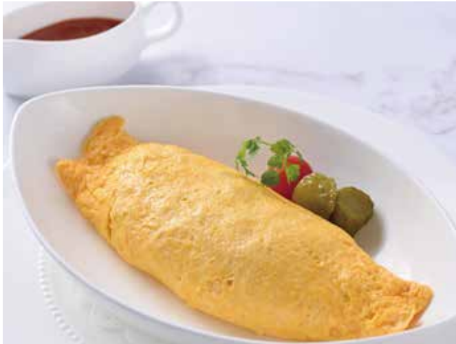
Fried Chicken Rice Wrapped with Egg Omelet Skin オムライス(ミニデザート付き)

Offer Time ご提供時間 11:00~14:00 | 17:30~20:30