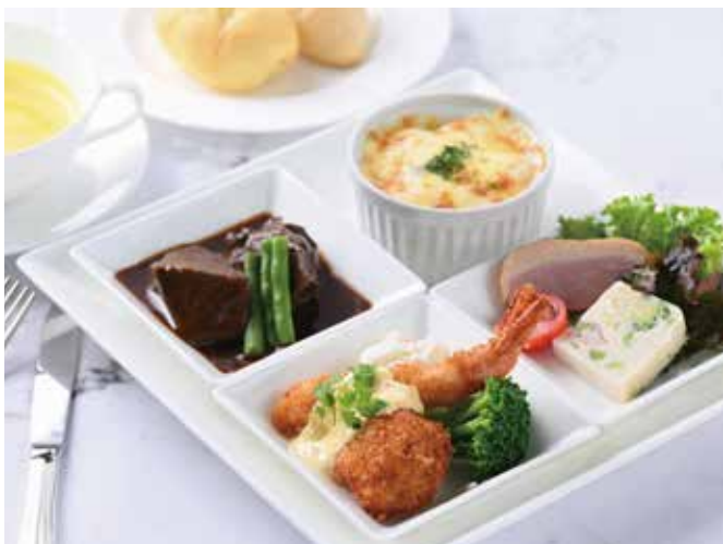
Sembikiya Platter with Soup, Mini Dessert, Coffee or Tea 洋食プレート

特定原材料等28品目: 小麦・乳・海老・いか・大豆・鶏肉・魚介類 Allergens: wheat, milk, shrimp, squid, soybean, chicken, seafood