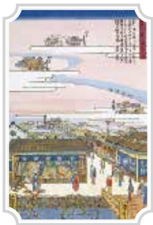
1834年(天保5年)頃 創業当時の様子