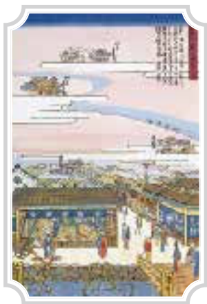
1834年(天保5年)頃 創業当時の様子