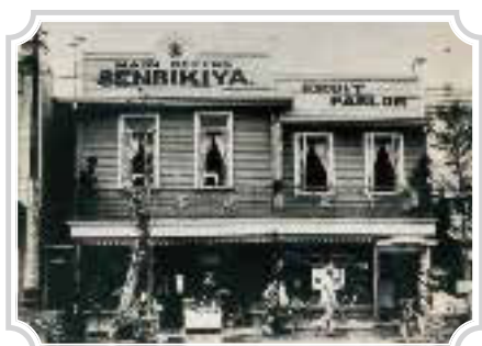
1923年(大正12年)頃 関東大震災後の室町本店

これまでに築き上げてきた信頼を財産とし、より多くのお客様がたと自然のめぐみを分かち合えるよう努めて参ります。 引き続きのご愛顧のほどよろしくお願ひ申し上げます。