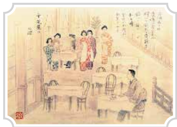
【1916年(大正5年)頃】 フルーツパーラーの様子