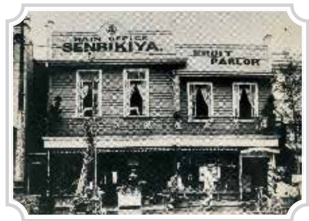
【1923年(大正12年)頃】 関東大震災後の室町本店

Around 1923: the flagship store in Nihombashi-Muromachi after the Great Kanto Earthquake