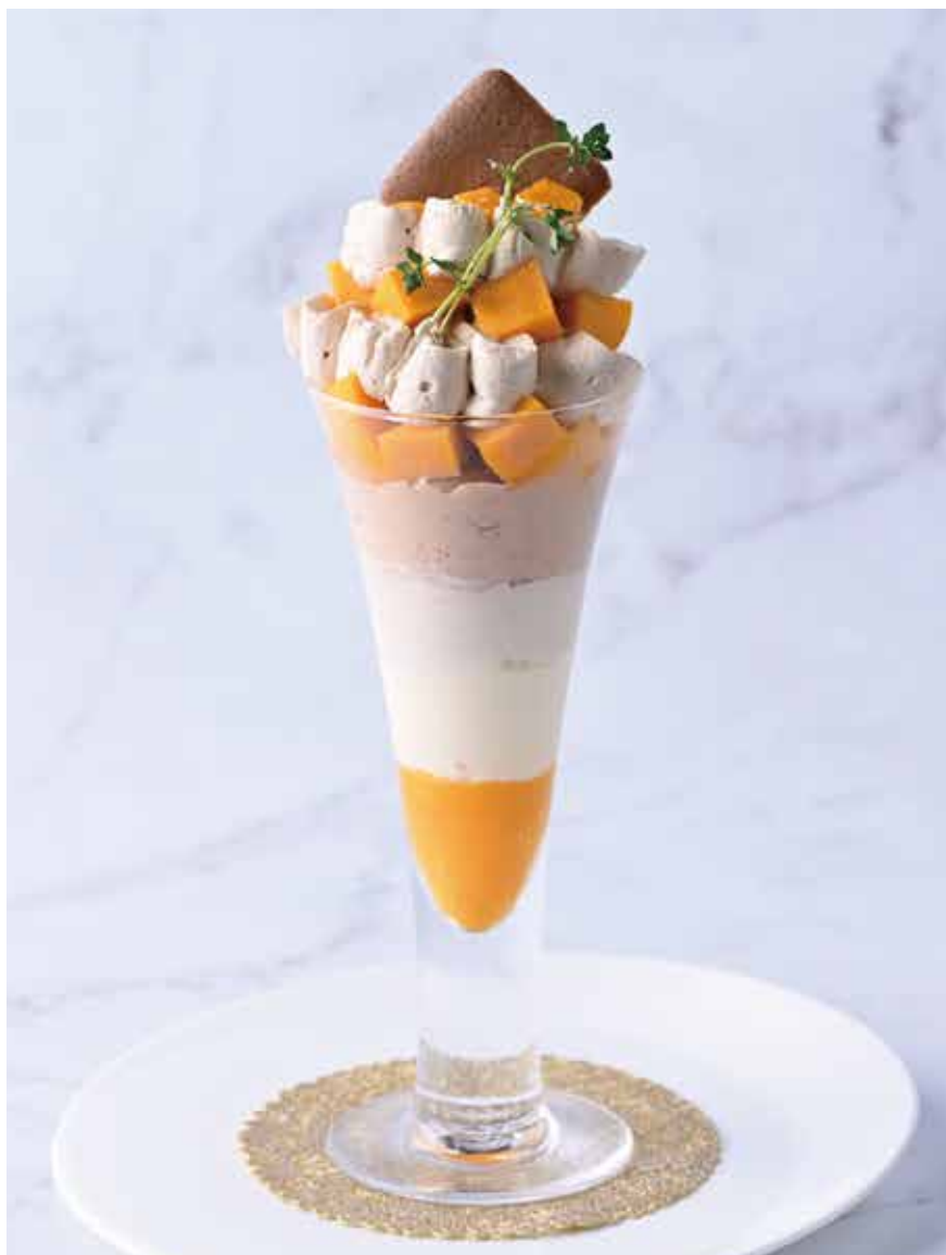
Mango and chai parfait