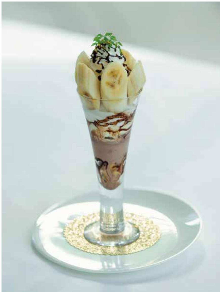
Banana Chocolate Parfait