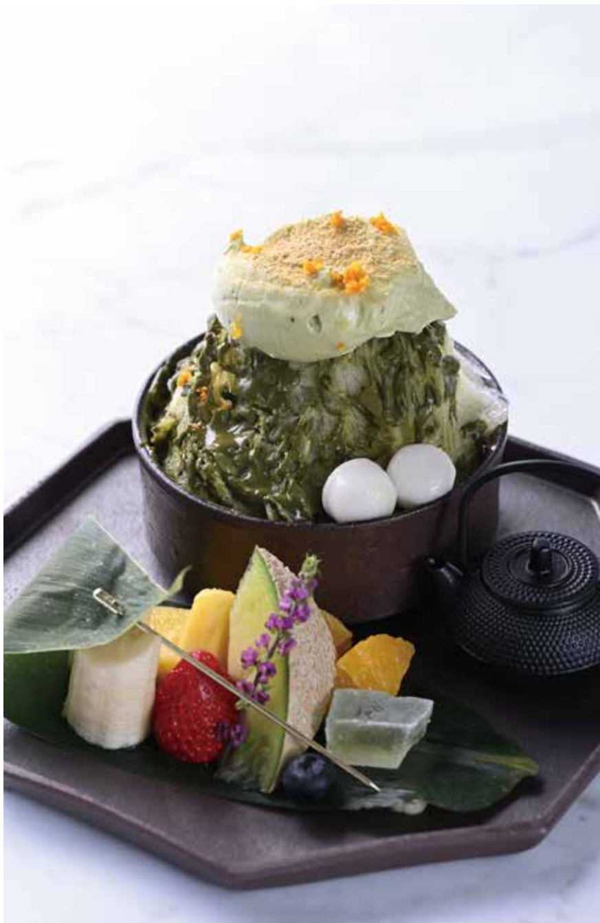
Shaved Ice Japanese NAGOMI - Jade