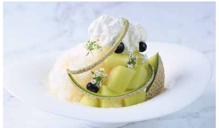
Shaved Ice with Musk Melon

特定原材料等 28 品目: 卵・乳・オレンジ・大豆・バナナ Allergens: egg, milk, orange, soybean, banana