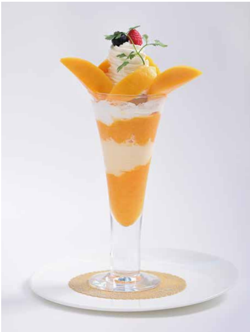
Miyazaki Prefecture Fully Ripe Mango Parfait