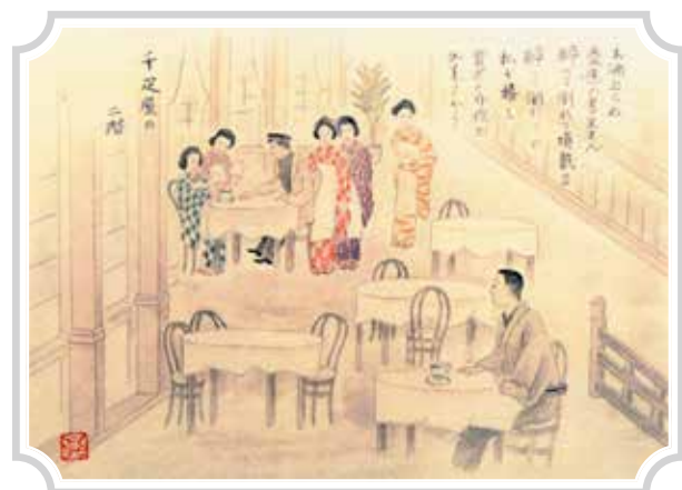
【1916年(大正5年)頃】 フルーツパーラーの様子