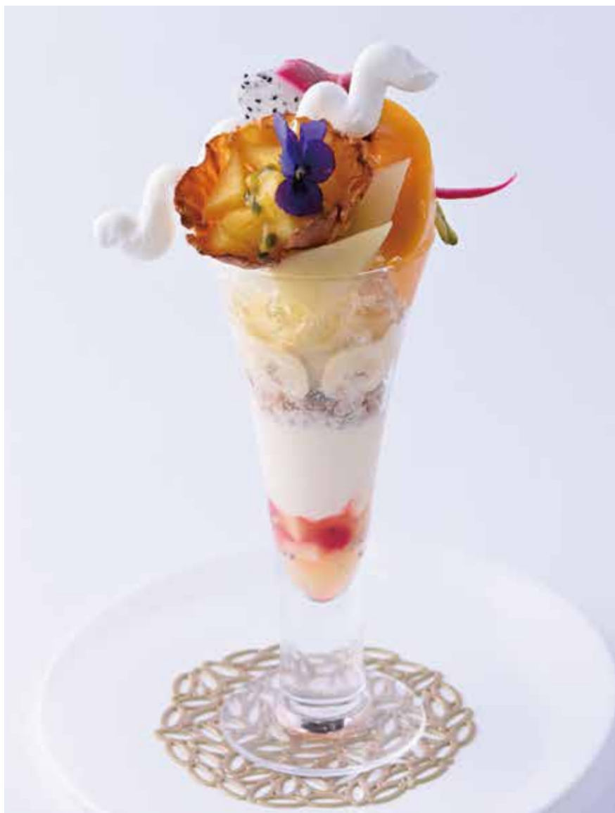
Tropical Fruit Parfait