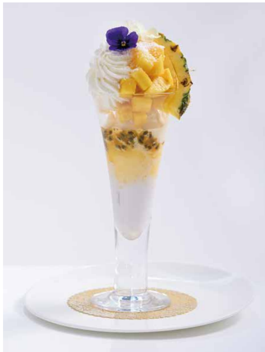
Pineapple and Coconut Parfait (with Nata de Coco)

特定原材料等28品目：卵・乳・小麦・オレンジ・キウイフルーツ・バナナ・ゼラチン Allergens: egg, milk, wheat, orange, kiwi, banana, gelatin