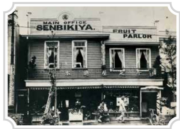
【1923年(大正12年)頃】 関東大震災後の室町本店

Around 1923: the flagship store in Nihombashi-Muromachi after the Great Kanto Earthquake