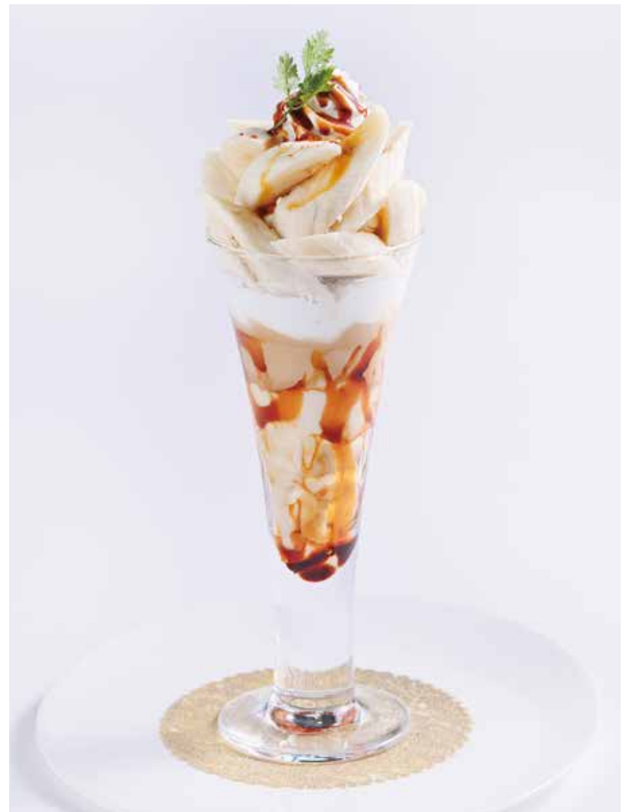
Caramel Banana Parfait