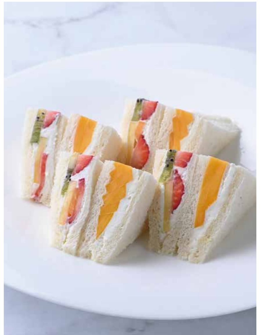
Seasonal sandwich Mango