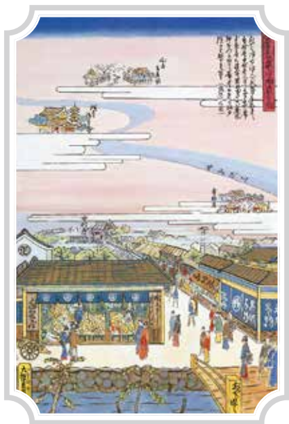
【1834年(天保5年)頃】 創業当時の様子