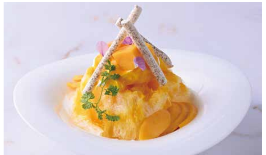
Shaved Ice with Two Kinds of Mango

特定原材料等 28 品目: 乳・大豆・ゼラチン Allergens: milk, soybean, gelatin